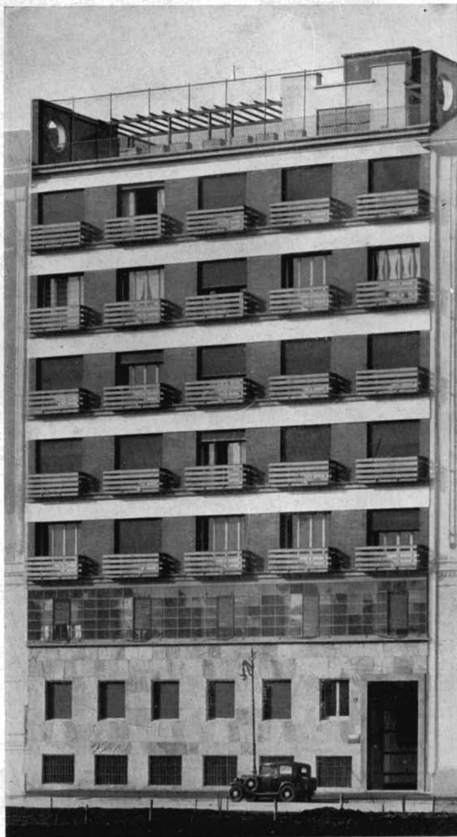
Arch. Piero Portaluppi - Casa d'abitazione a Milano, facciata

successivi arretramenti che si iniziano dal primo piano, permette una successione di terrazze in parte coperte ed in parte scoperte.