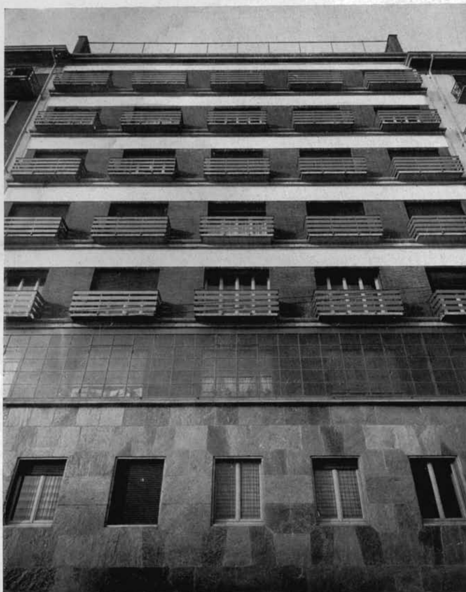
Veduta prospettica della facciata