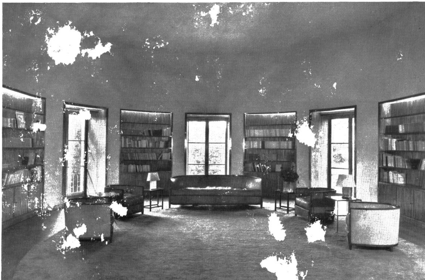
(sopra e accanto) JEAN-MICHEL FRANCK - PARIGI - Sala ovale di ricevimento nella casa del Conte Pecci Blunt a New-York. Gli interni della nicchia e delle librerie, e le porte sono ricoperte di paglia e gli stipiti sono contornati da sottili strisce di metallo dorato opaco.