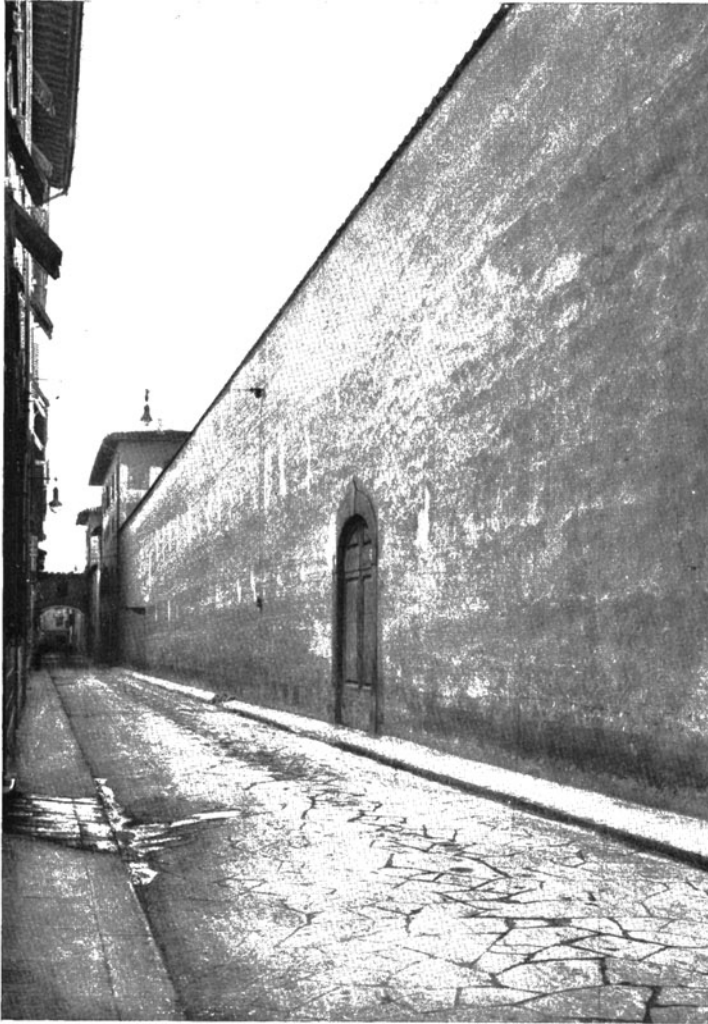
Muro di cinta di un giardino in Via Laura a Firenze.