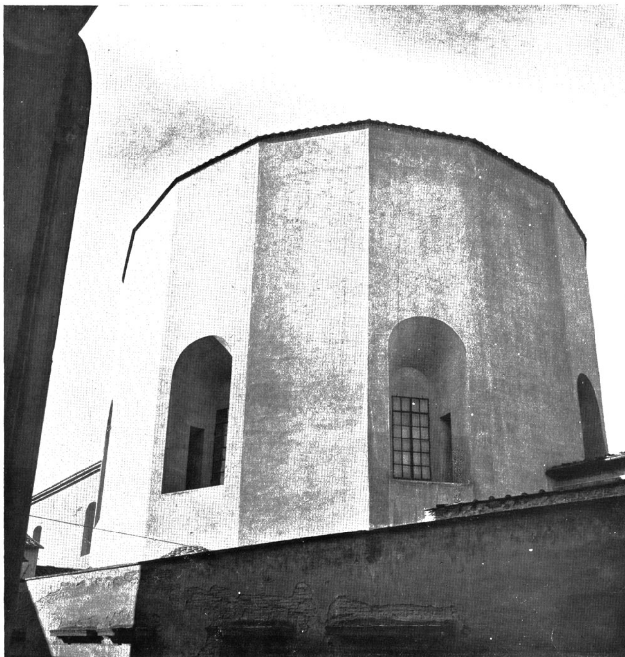
Tamburo della cupola nella Chiesa della S.S. Annunziata di L. Battista Alberti a Firenze.