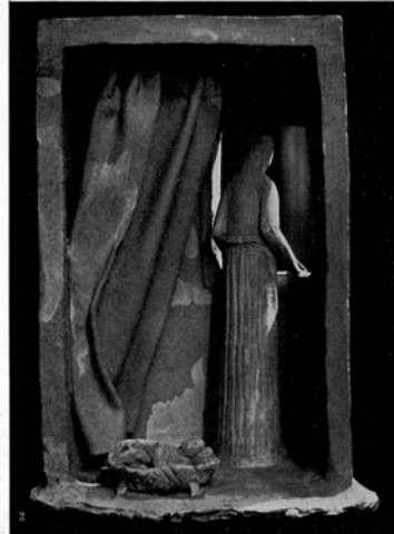
Arturo Martini "A ttesa"