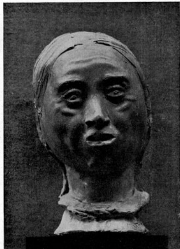
Arturo Martini Testa di Chinese

A questo proposito osservo ancora una volta che il gusto del racconto porta l'artista a dar vita a soggetti che, così come egli li concepisce, s'addicono più alla pittura che alla scultura: tipicissimi esempi, il Nievo che si inabissa nei fusti marini, il Chiara di luna dell'ultima Biennale e specie al-