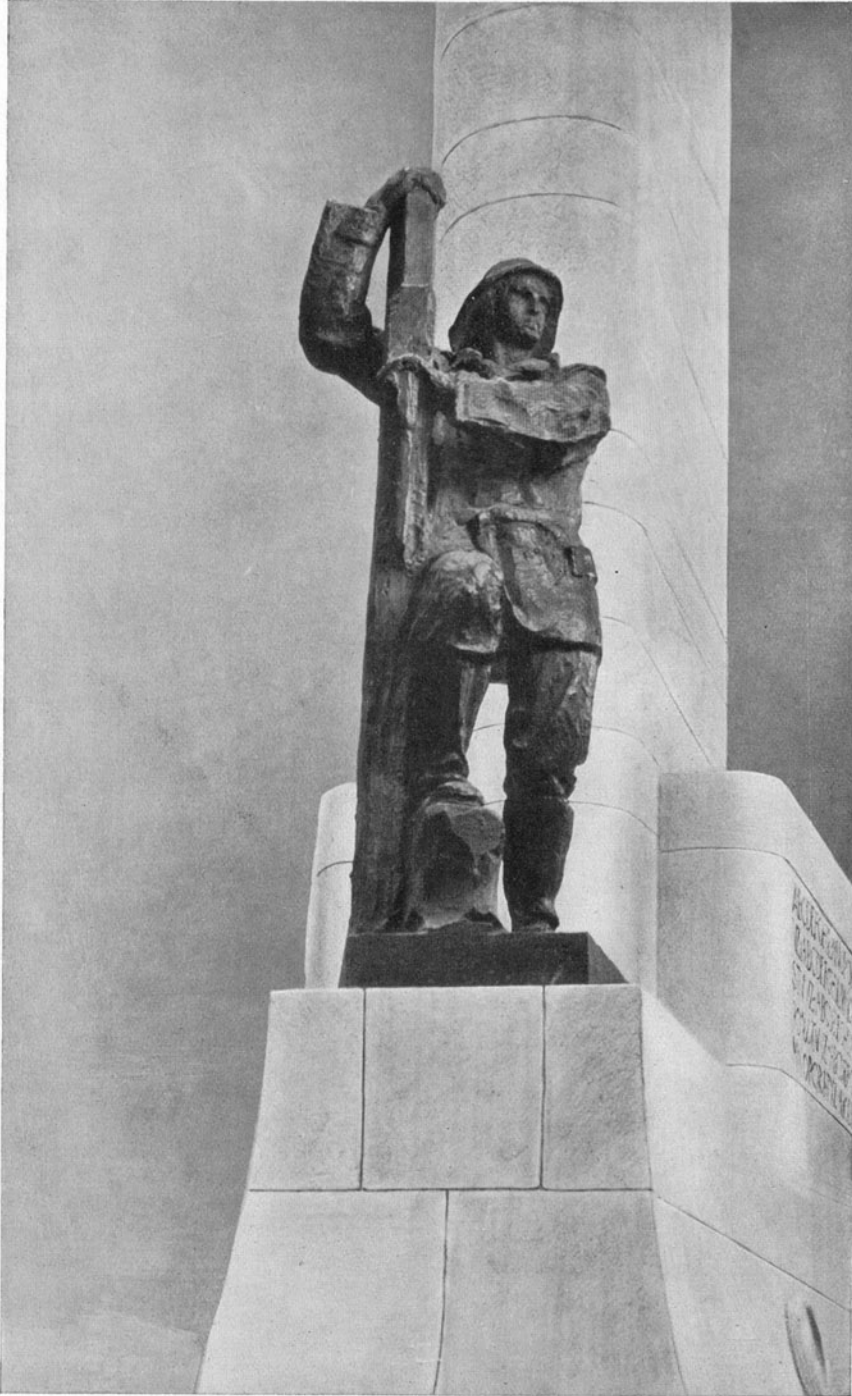
ATTILIO SELVA - MONUMENTO A NAZARIO SAURO.