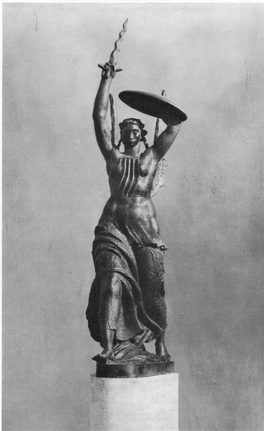
SCULTURA RAFFIGU- RANTE L'ISTRIA RE- DENTA.