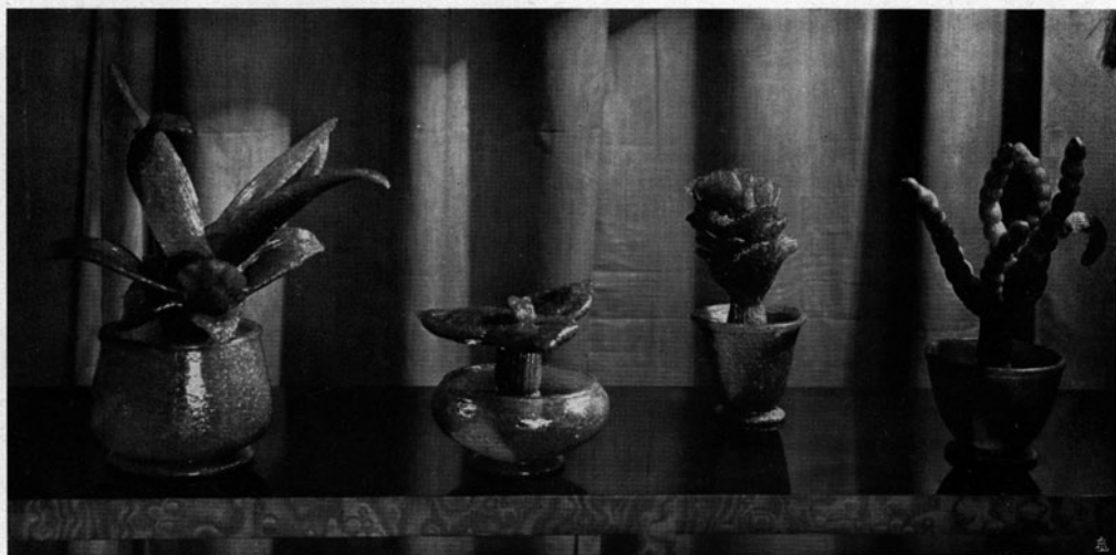
PIANTE GRASSE IN VETRO PULEGOSO VERDONE, EDITE DALLA V. S. M. VENINI & C., VENEZIA