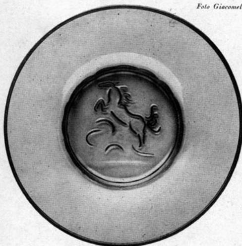
Fig. 1 PIATTO IN VETRO SOFFIATO. SU DISE- GNO DI NAPOLEONE

MARTINUZZI, EDITO DALLA V. S. M. VE- NINI & C., VENEZIA