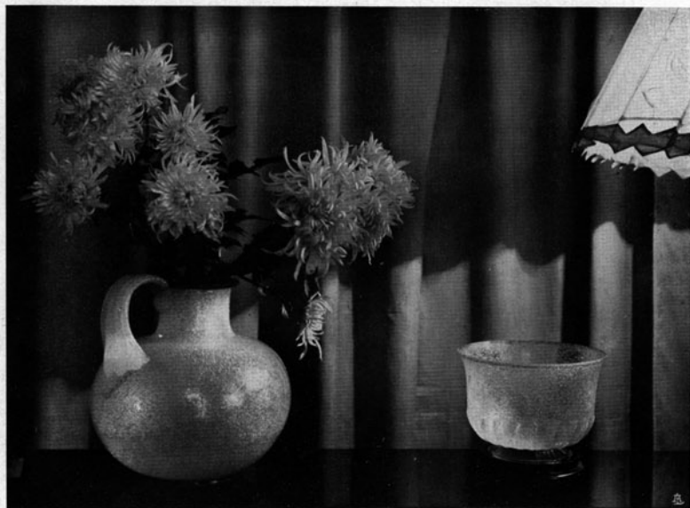
Fig. 4 VASO E COPPA IN VETRO PULEGOSO BIANCO CON

ORLO AZZURRO - EDITE DALLA V.S.M. VENINI & C., VENEZIA